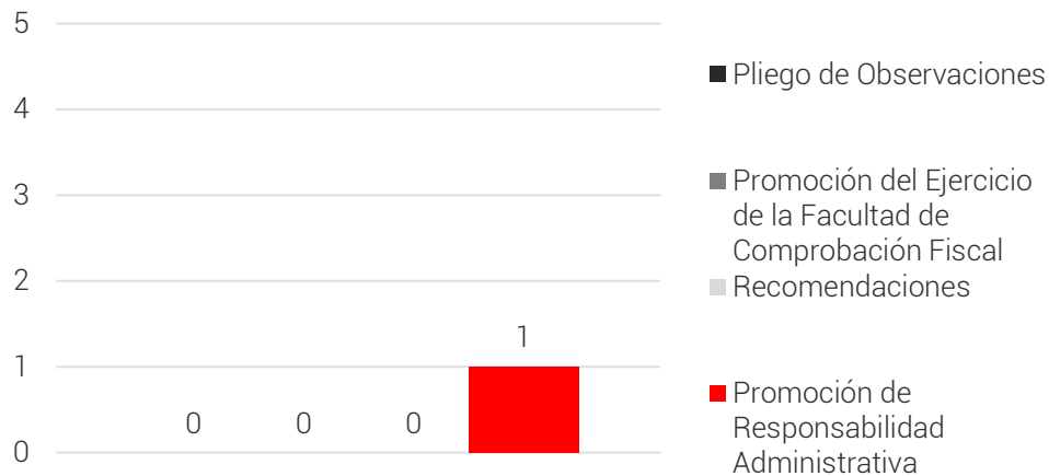
Resumen de las Acciones Derivadas de las Observaciones

Como resultado de los procedimientos de auditoría se emitieron observaciones por las cuales el ente auditado proporcionó documentación. En ese sentido, se presenta a continuación una síntesis de las justificaciones y aclaraciones presentadas por la entidad fiscalizada, la acción que en su caso, se promueve como consecuencia de la no atención de las observaciones y el estatus de las mismas.