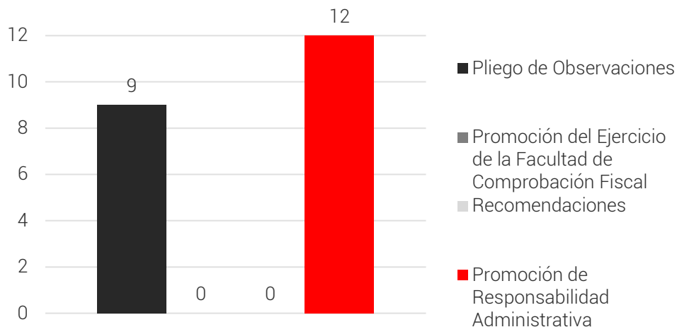
Resumen de las Acciones Derivadas de las Observaciones

Como resultado de los procedimientos de auditoría se emitieron observaciones por las cuales el ente auditado proporcionó documentación. En ese sentido, se presenta a continuación una síntesis de las justificaciones y aclaraciones presentadas por la entidad fiscalizada, la acción que en su caso, se promueve como consecuencia de la no atención de las observaciones y el estatus de las mismas.