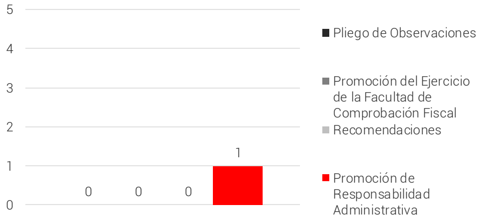
Resumen de las Acciones Derivadas de las Observaciones

Como resultado de los procedimientos de auditoría se emitieron observaciones por las cuales el ente auditado proporcionó documentación. En ese sentido, se presenta a continuación una síntesis de las justificaciones y aclaraciones presentadas por la entidad fiscalizada, la acción que en su caso, se promueve como consecuencia de la no atención de las observaciones y el estatus de las mismas.